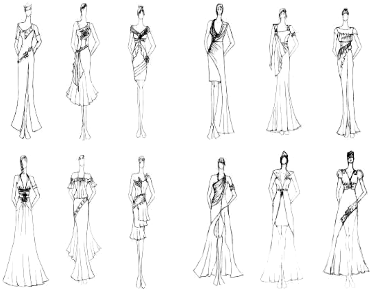
شکل ۱- اتود های اولیه

بصورت تزئین استفاده شود. در پایین دامن نیز شیشه های رنگی شکسته سمباده کشیده شده بکار رفته است که اطراف آن با سیم مقنول دور پیچی شده است. طرح این مدل از برش منحنی که این خط نشانه لطافت و مهربانی است و تریسمات هلالی شکل برای چشم آسانتر و راحت تر می باشد، خط عمود این خط حالت ایستایی دارد و حرکت به سمت بالا را نیز القاء می کند.