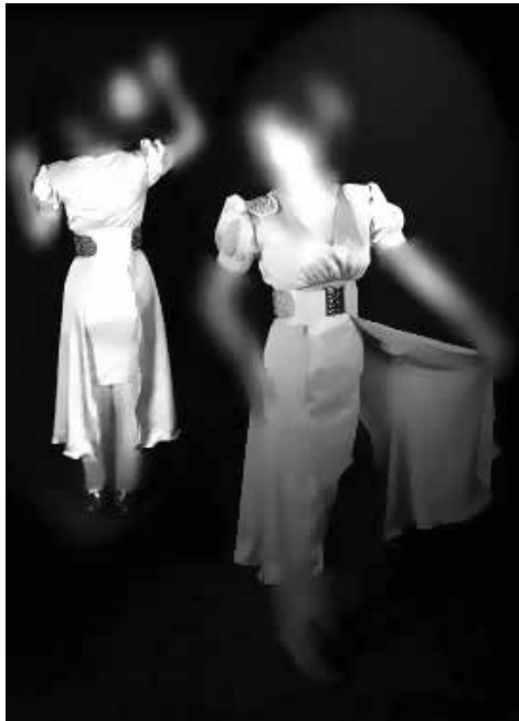
شکل ۴- دوخت نهایی مدل شماره ۴