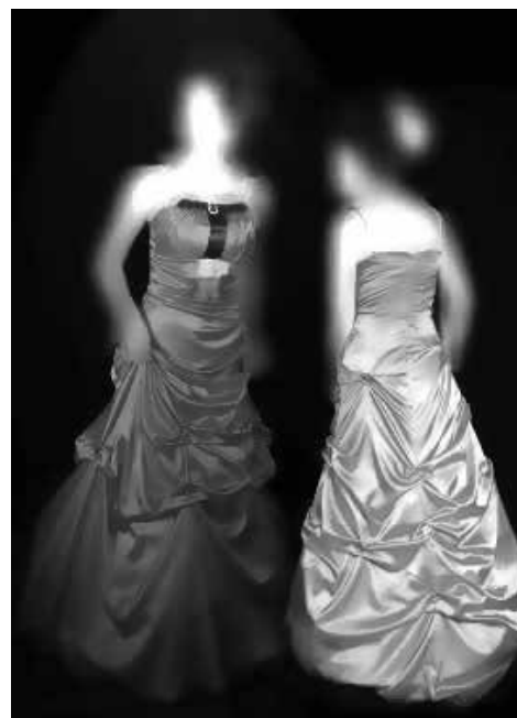
شکل ۷- دوخت نهایی مدل شماره ۵

۱- دانشگاه آزاد اسلامی، واحد یزد، دانشکده هنر، گروه طراحی پارچه و لباس، یزد، ایران