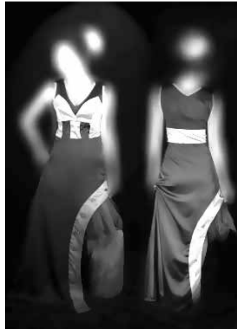
شکل ۵- الگو مدل شماره ۳