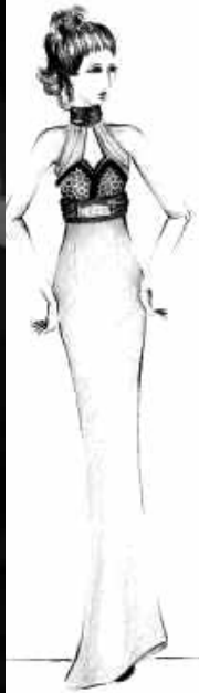
شکل ۴- دوخت نهایی مدل شماره ۲

بوده، سمت راست آن از قسمت زیر باسن کوتاه، در زیر آن دارای طور می باشد که به آستر پیراهن متصل شده است.